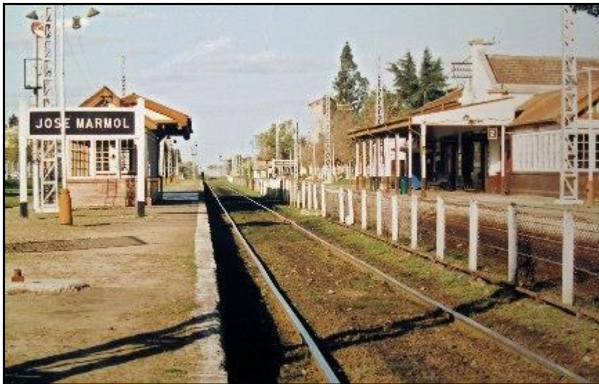
“Antigua Estación José Mármol”

La Estación y el Pueblo de José Mármol aparecen hermanados por su nacimiento y por su nombre. En cuanto al origen de la primera, se produjo en el marco de una crisis política que enfrentó a los gobiernos nacional y provincial por la federalización de la ciudad de Buenos Aires, hasta entonces capital provincial.