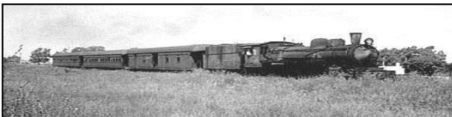
"Antigua imagen del Ferrocarril"

A partir de 1927 circulaba por la zona la línea Avellaneda-La Plata del Ferrocarril Provincial, siendo la estación más cercana la Parada Paseo, sobre la Avenida Paseo, luego Pasco y actualmente Eva Perón. Comunicaba los pueblos de Lanús Este, el Barrio San José, San Francisco Solano y los márgenes de la Avenida Monteverde.