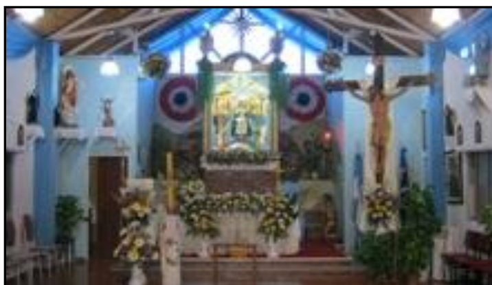
“Interior de la Iglesia Nuestra Señora de Caacupé”

La Iglesia Nuestra Señora de Caacupé sita en Amenedo y San Luis, se construyó por iniciativa y con el esfuerzo de los vecinos, en el corazón del Barrio que lleva su nombre.